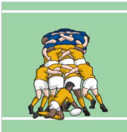
„Pushover“ - Versuch