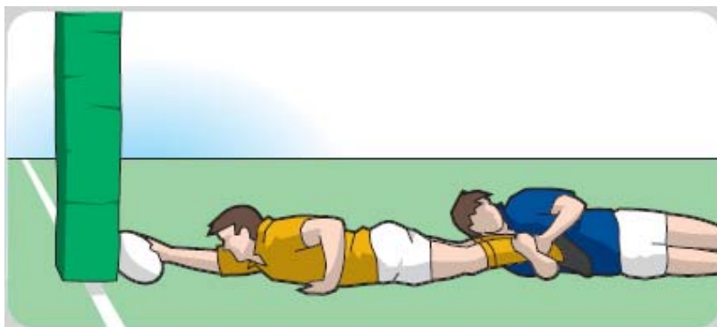
Den Ball gegen die Malstange ablegen